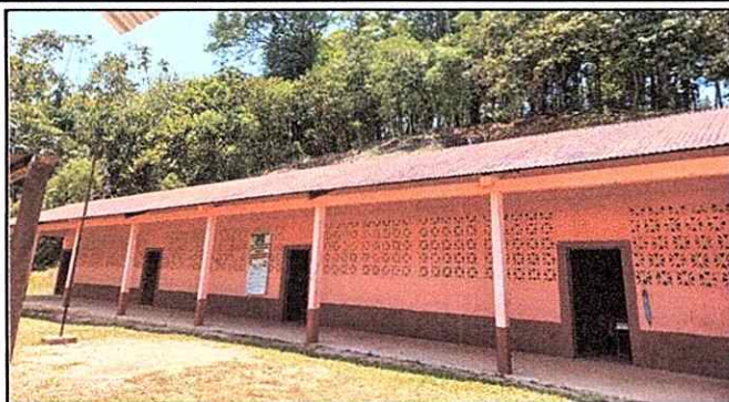
Foto1: Sustitucion de Laminas.